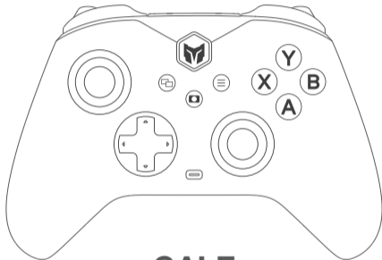
GALE Wireless Game Controller